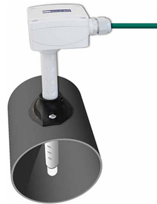
SK10-TTHC-KFF Kanalfühler + ext. PT1000 Anschluß