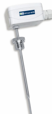
SK10-TC-ETF7 Einschraubfühler / Tauchhülse Fühlerlänge: 100, 150, 250 mm mit verlängertem Schaft und Halsrohr