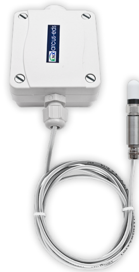
SK10-TC-RPTF1 Raumpendelfühler 1,5m PVC