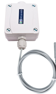
SK10-TC-OFTF Anlege- / Oberflächenfühler 1,5m PVC