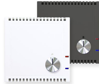
SK30-TTHC-R weiß / anthrazit