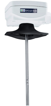
SK01-T-KTF1 mit Kanalfühler inkl. Montageflansch Fühlerlänge: 50,100,150,200,250,300,400 mm V4A