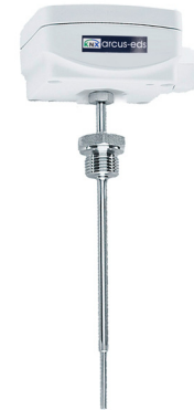
SK01-T-ETF7 mit Einschraubfühler / Tauchhülse Fühlerlänge: 100, 150, 250 mm mit verlängertem Schaft und Halsrohr