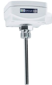
SK01-T-ETF1 mit Einschraubfühler / Tauchhülse Fühlerlänge: 50,100,150,200,250,300,400 mm Messing vernickelt