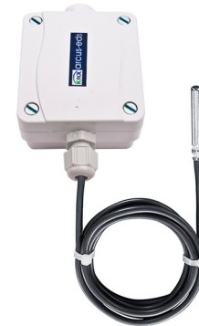
SK01-T-HTF mit Hülsenfühler 1,5m (PVC / Silikon / PTFE)

Artikel-Nr.: 30101002 / 30101003 / 30101055